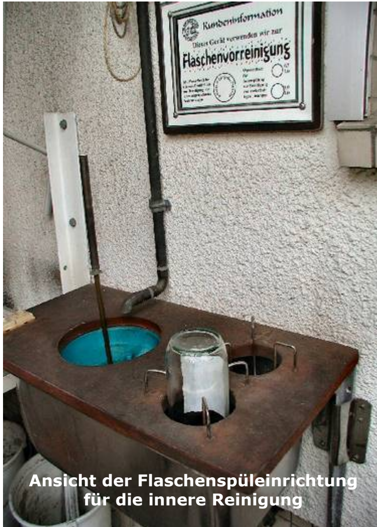
Ansicht der Flaschenspüleinrichtung für die innere Reinigung

Als wir Ende der siebziger Jahre über unseren Eigenbedarf Apfelsaft und Obstweine produzierten, mussten wir uns auch mit Flaschenabfüllung und Flaschenreinigung befassen. Die Beschaffung kostenloser gebrauchter Flaschen war kein Problem. Problematisch und zeitaufwändig war die innere Reinigung der gesammelten Flaschen der unterschiedlichsten Formen. Kaum jemand hatte seine abgestellten Flaschen nach der Entleerung vorgespült oder gereinigt. Verschiedentlich waren die Trübrückstände bei der offenen Lagerung angetrocknet. In den verschlossenen Flaschen waren die Fruchtsaft- oder Weinreste vom anhaftenden Schimmel verzehrt.